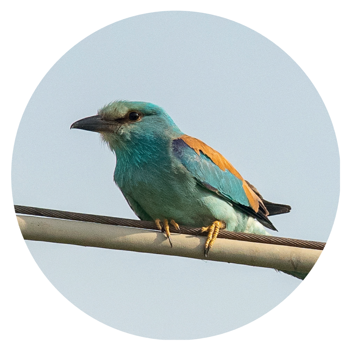
Ghiandaia marina (Coracias garrulus)