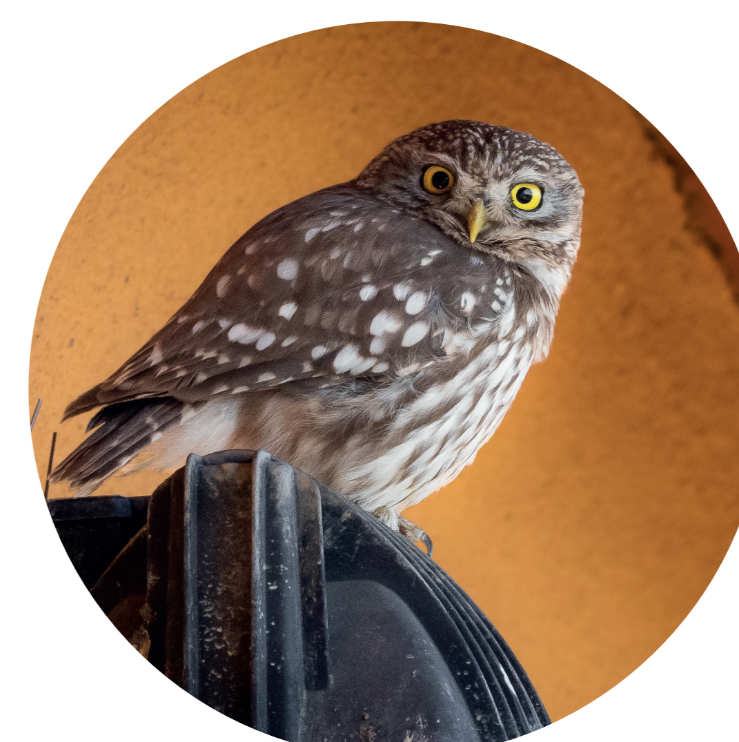
Civetta (Athene noctua)

GLI AMICI DEL GRILLAIO Le torrette sono pensate per il Grillaio ma a volte ospitano altre specie con abitudini simili!