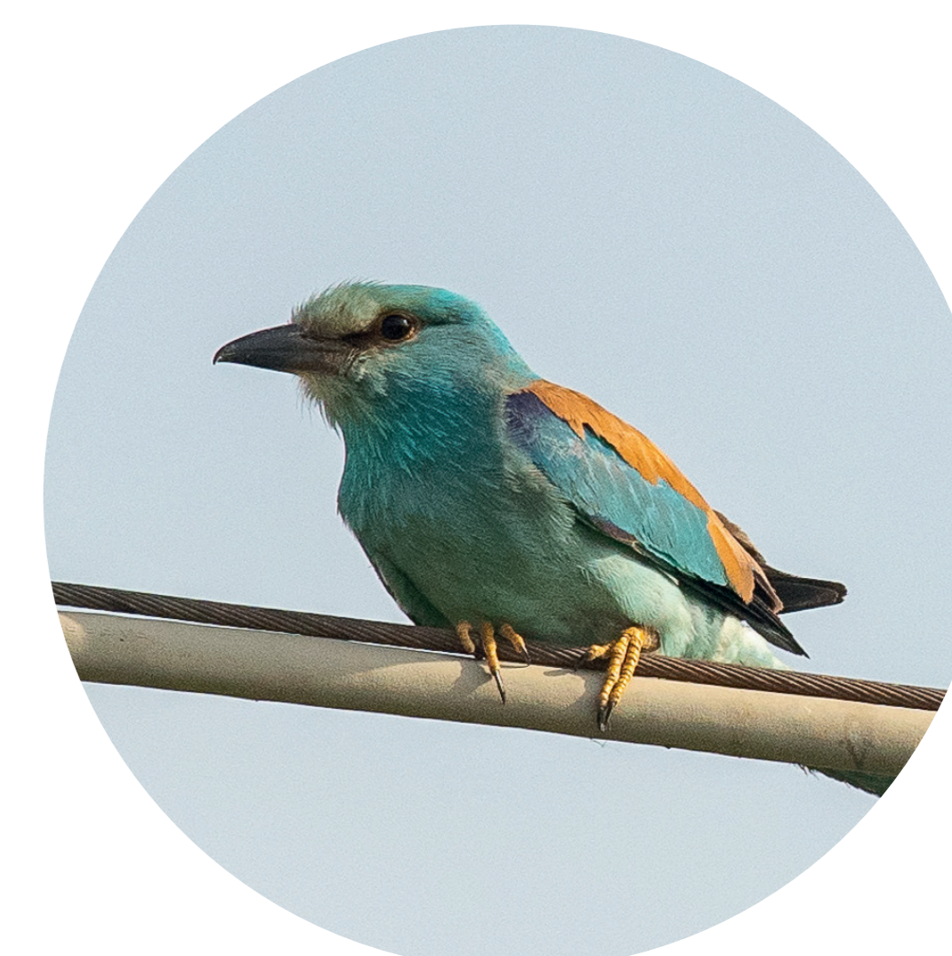
Ghiandaia marina (Coracias garrulus)